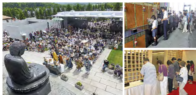
ふる里霊廟 合同供養祭の様子

ふる里霊廟は平成18年6月の開設以来大変ご好評をいただき、10,000名あまりのお客様にご利用いただいております。平成20年より開催し、毎年多数ご参列をいただいている『ふる里霊廟合同供養祭』を今年も開催いたします。