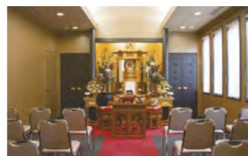
▲礼拝堂使用料(30分)5,400～10,800円